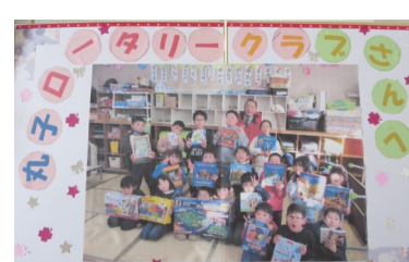
各児童クラブ（丸子中央、丸子北、塩川、西内）よりお礼の手紙を頂きました

事務所/〒386-0404 上田市上丸子1695 丸子コミュニケーションセンター内